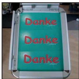
Klapprahmen Hoch- oder Querformat