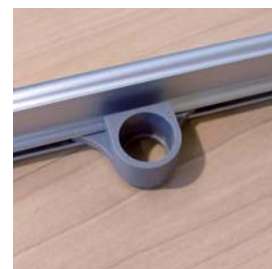
Grafikklemmschiene wird oben auf die Stange aufgesteckt!